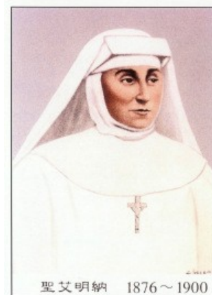
聖艾明納 1876~1900 St. Mary Hermina of Jesus

「我們不要憂慮，要保持平靜和信德；我們是天主的兒女；有天主照顧，我們將無所缺。讓我們全心依賴永生的天主吧！」當艾修女和她的六位姐妹修女日後坐監時，仍堅定平安地說：「我來中國的目的，是為基督獻出我的血和生命。」1900 年 7 月 9 日艾修女率領她的修女們赴難時，她先唱了拉丁文的「讚美天主」(Te Deum)，感謝天主賜給她們殉道的恩寵，她又擁抱了她的每一位修女，之後，她把頭放在刀下。劊子手一揮刀，鮮血立即沖出；艾修女白色的會衣就被染成紅袍。24 歲的艾修女成了她修會的第一位殉道者。